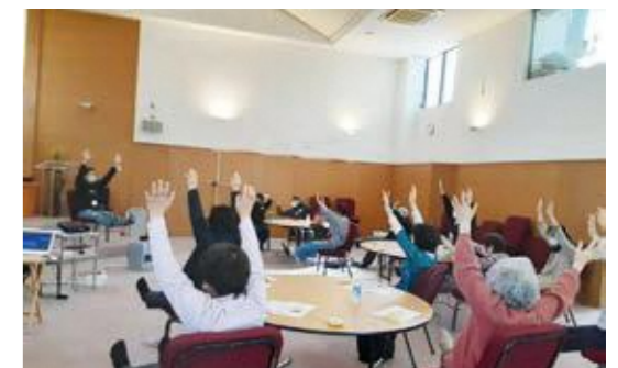
▲北信カルバリーオレンジカフェ

※開催日時を変更して実施または休止となっている場合があります。 参加をご希望の際は各カフェに事前にお問い合わせください。