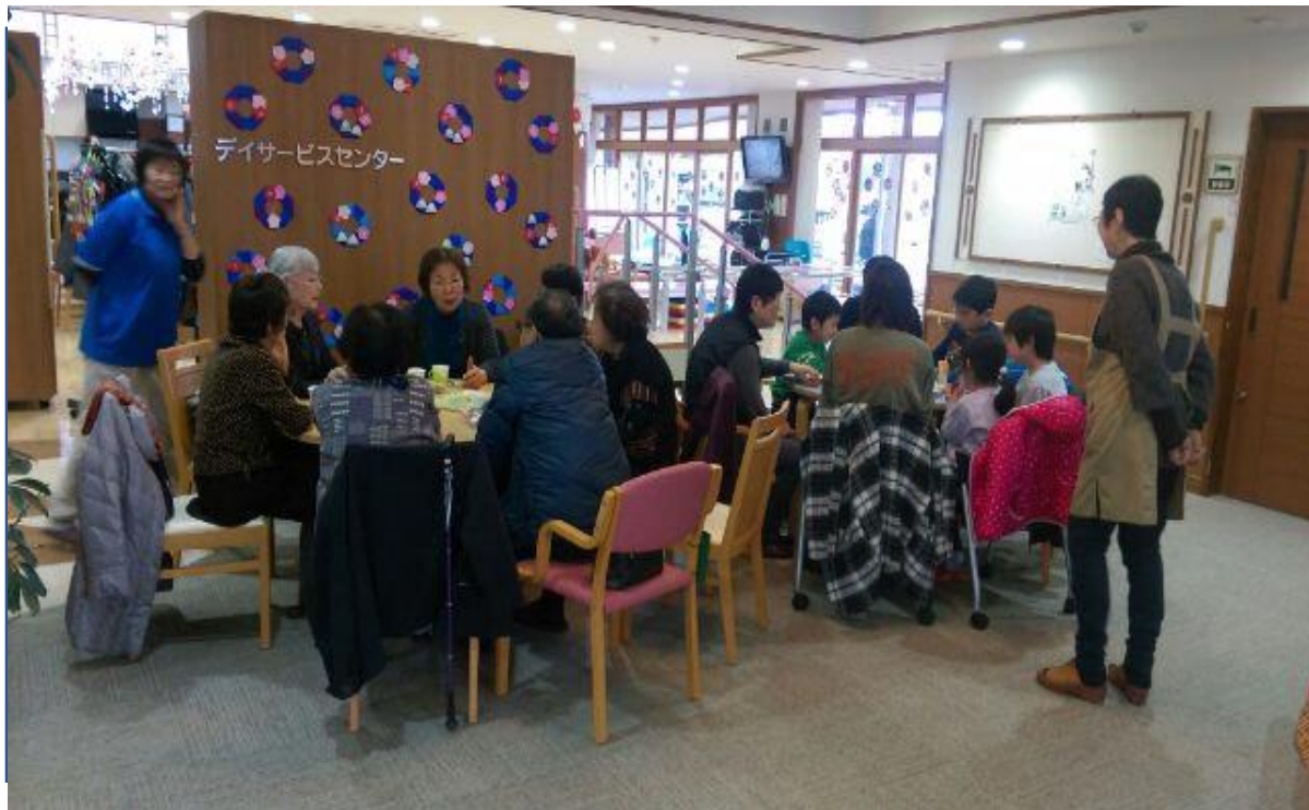
▲クリスマス前での「なごみっこ」子どもたちもたくさん来て下さいました。

今回は折り紙でクリスマスの飾りやサンタ作りを互いに教え合い、聞き合いして賑やかに過ごしました。制作後は、きよしこの夜を歌ったり、焼き上がりのパンに生クリームとみかんを乗せて食べてみたらクリスマスケーキみたいで美味しかったですよ。