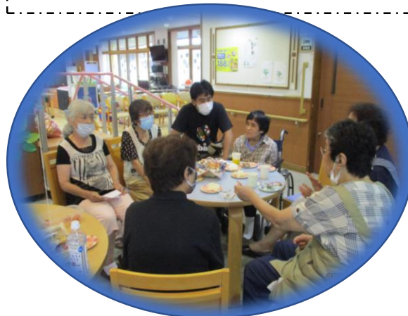
▲お休み明け後、ケアマネさんと一緒に参加。みんなと会えて嬉しかったです。